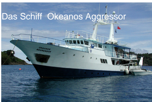
Das Schiff Okeanos Aggressor

Die Insel hat mehrfach Berühmtheit erfahren, so sagt man, dass sie als Anregung für den Roman "Die Schatzinsel" (Treasure Island) des schottischen Autors Robert Louis Stevenson diente; zuletzt war sie Schauplatz für die Verfilmung des Kinofilms "Jurassic Park".